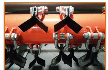
Version BMF120M Rotor avec fléaux Y de 40 x 5 mm sur manilles